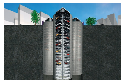
Die clevere Lösung: U-Park® von Herrenknecht bietet bis zu 90 Parkplätze im Untergrund.

Damit gehört die zeitaufwändige Parkplatzsuche in Innenstädten der Vergangenheit an. Ein cleveres, computergestütztes System an der Oberfläche sorgt dafür, dass die verschiedenen Parkschächte effektiv von oben nach unten gefüllt werden. Das äußere Bild der Stadt wird durch U-Park® Systeme nicht beeinträchtigt. Der PKW wird an der Oberfläche auf ein automatisches Plateau gefahren und gleitet auf diesem in den Parkschacht hinab. Während des ganzen Prozesses bleibt der Motor des PKW ausgeschaltet. Hierdurch entfallen aufwändige Einbauten zur Luftfilterung und Bewetterung - ein weiteres Plus für die Umwelt!