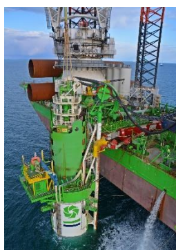
Bild 5 Offshore Foundation Drilling: OFD-Maschine wird in die MODIGA eingesetzt (Monopile Offshore Drilling Installation and Grouting Aid), Windpark Saint-Nazaire 2021-2022